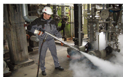
其它高温蒸汽领域